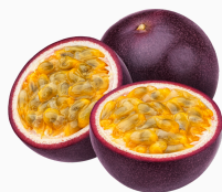
FRUIT DE LA PASSION